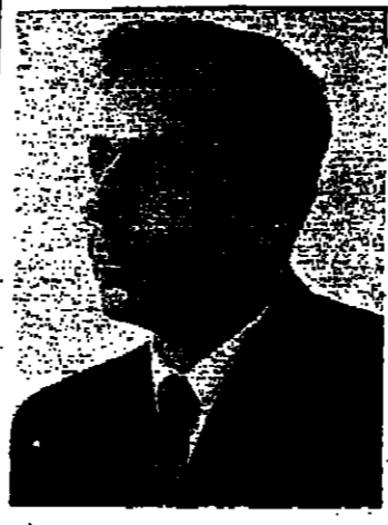
أحد المشاركين في لقاء القمة في اسوان اليوم

في اواخر شهر يناير - كانون الثاني الحالي تكفل للرحلة الاولى من مراحل اتفاقية كامب ديفيد ومعاهدة السلام بين مصر واسرائيل الى خط العرضي - رائسي محمد في حالة السلام وحسن الجوار بين البلدين ، ويعد عهد تطبيع العلاقات بينهما تطبيعاً ما حدث طوال الفترة التي اصرحت فيها مصر على جماعته التزم وتحتسب اليوم ويصل الى ان من الضروري للتعامل مع حالات تطبيع العلاقات حتى الى درجة لا يتطابق ايمان ما بما حدث طوال الفترة التي اصرحت فيها مصر على جماعته التزم وتحتسب اليوم بما حدث طوال الفترة التي اصرحت فيها مصر على جماعته التزم وتحتسب اليوم